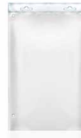
Eurolochbeutel mit Verstärkung

Der Sparsame: ohne Aufhängeverstärkung für leichte Füllgüter; unterhalb der Euroleiste quer geschweißt, optional mit Klebeverschluss und mehreren Eurolöchern.