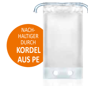
NACHHALTIGER DURCH KORDEL AUS PE

Unterhalb des Grifflochs ist der Tragebeutel quer geschweißt; für einfache und schnelle Befüllung von unten.